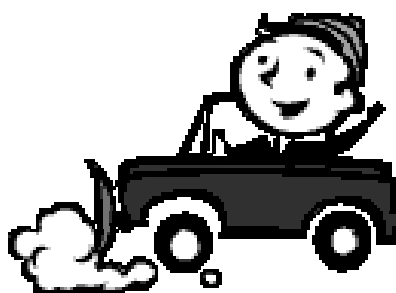
Alternativ Bil-O bil?

Förutom bilarna hade vi med vår vikkvägg med information om klubben, det visades även rallyfilmer på stor tv-skärm. Stort tack till alla som ställde upp. Vi hoppas att det kan väcka något intresse för bilsport, som alternativ till "pimpade" gatracers med platta däck och för mycket ljud.